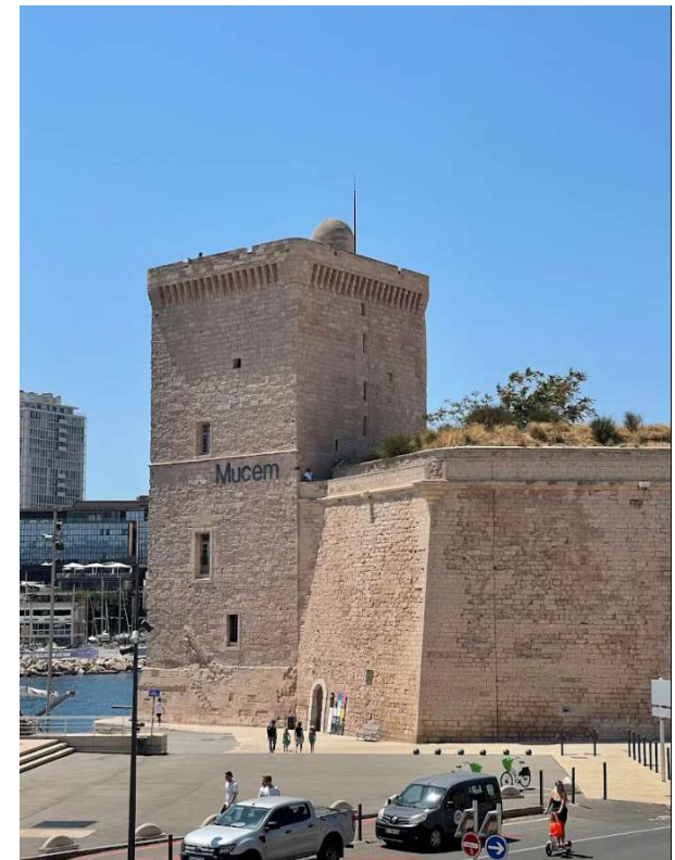
Tour du Roi René